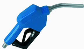
AdBlue en vrac