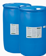
Fût de 210 litres avec pompes