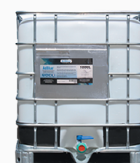
IBC de 1000 litres avec plongeur